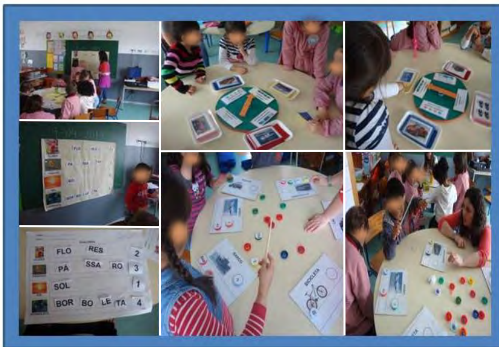
Figura 10 – Jogos de linguagem realizados no estágio do Pré-Escolar