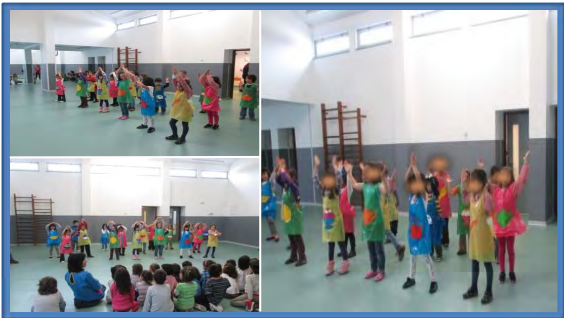
Figura 6 – Jogos musicais realizados no estágio do Pré-Escolar

Foi a pensar em tais potencialidades que decidimos explorar este tipo de jogos no nosso estágio.