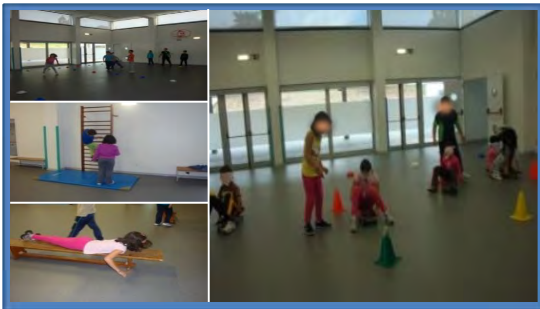
Figura 4 – Jogos motores realizados no estágio do 1.º Ciclo do Ensino Básico

Nesta atividade, selecionámos como competência associada, a competência social e de cidadania, pois pretendia-se que os alunos respeitassem os colegas e as regras estipuladas. Por ser uma área transversal ao currículo, esteve presente ao longo de toda a realização deste jogo.