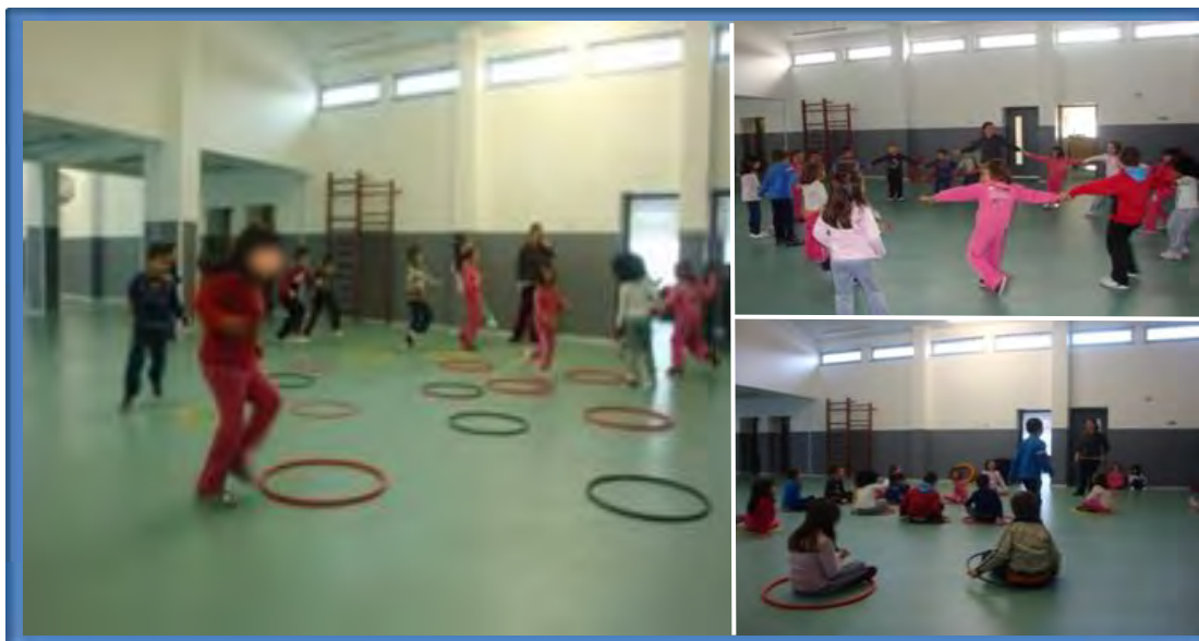
Figura 3 – Jogos motores realizados no estágio do Pré-Escolar

Na área de Expressões, no domínio da Expressão Motora e subdomínio: Jogos, na nossa primeira intervenção, no Pré-Escolar, realizámos um jogo coletivo denominado por: o jogo dos coelhos e as suas tocas.