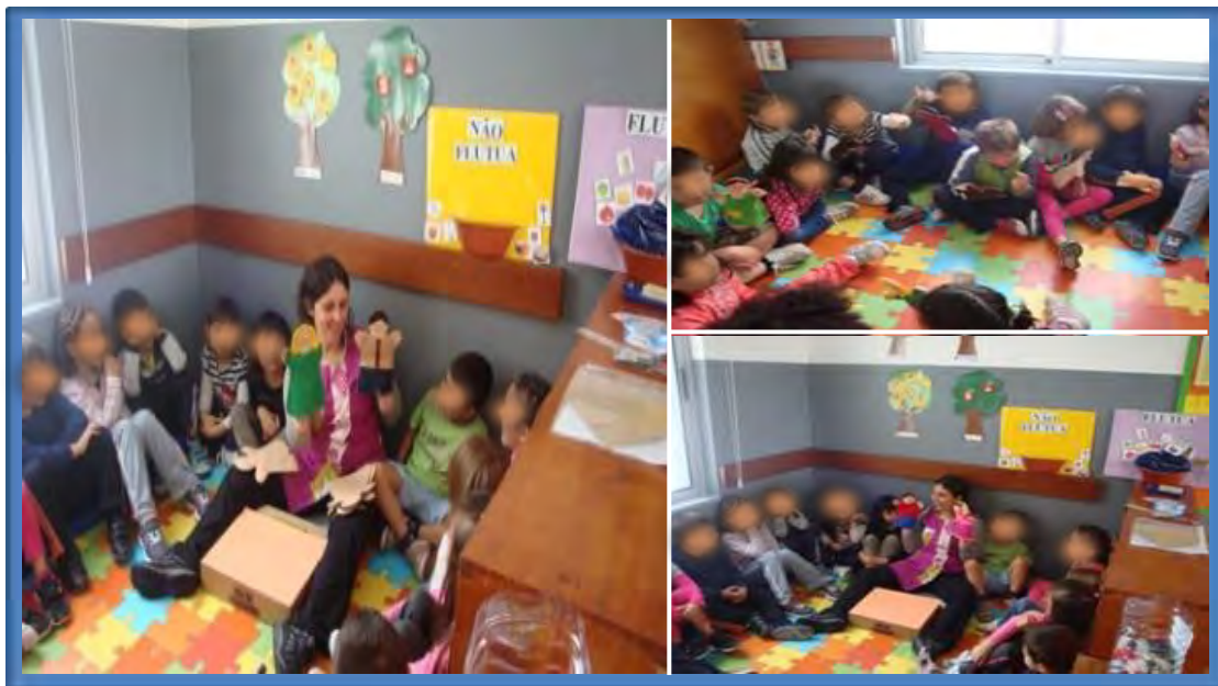
Figura 7 – Jogos dramáticos realizados no estágio do Pré-Escolar