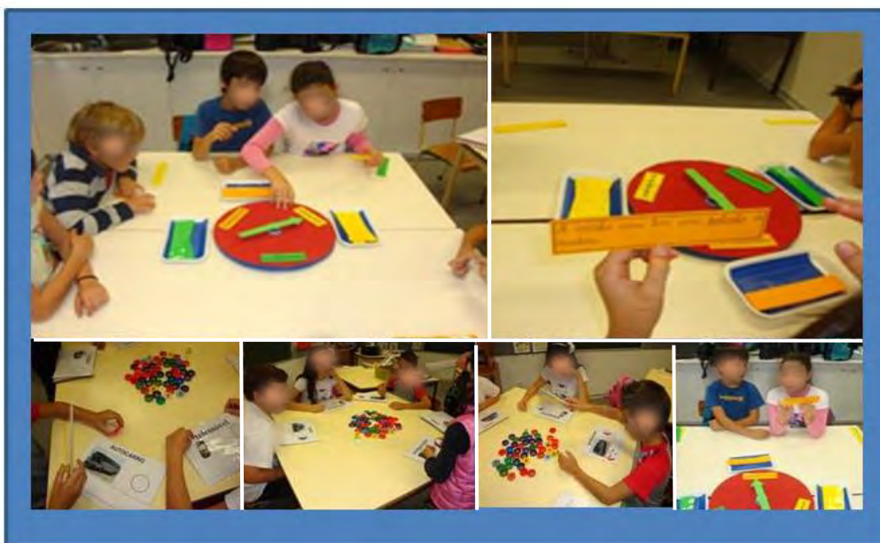
Figura 11 - Jogos de linguagem realizados estágio do 1.º Ciclo

Na nossa terceira intervenção, em contexto Pré-Escolar, realizámos dois jogos: a roleta dos meios de transporte e a pesca silábica.