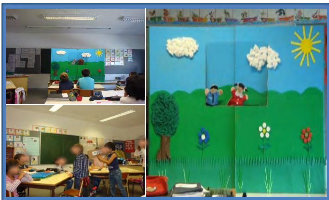
Figura 8 – Jogos dramáticos realizados no estágio do 1.º Ciclo