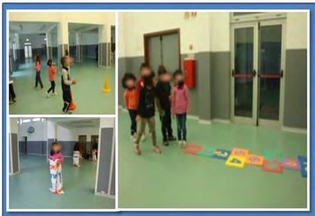
Figura 2 – Jogos tradicionais realizados no estágio do Pré-Escolar

Este foi o pressuposto que esteve na base da exploração de alguns jogos tradicionais que levámos a cabo no nosso estágio do Pré-Escolar, que ilustramos na figura seguinte (ver figura 2).