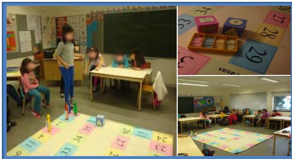
Figura 5 – Jogos de cooperação realizados no estágio do 1.º Ciclo do Ensino Básico

A organização desta atividade foi feita da seguinte forma: primeiramente formaram-se quatro equipas, cada aluno lançava o dado e de seguida, respondia a uma questão. De seguida, discutia-se com a equipa a resposta a dar e respondia-se. Depois passava-se a vez à equipa seguinte e assim sucessivamente.