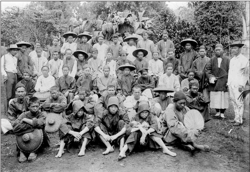
1 - Grupo de Coolies da roça Monte Café.

As passagens de trabalhadores asiáticos foram por demais efémeras para deixarem traços marcantes na sociedade insular. Ao invés do sucedido noutros meios coloniais, onde o contingente de importados indianos acabou suscitar mudanças nas relações de trabalho sucedâneas da escravatura ou conduzir à gestação de sociedades com alguma compartimentação social e cultural, em S. Tomé e Príncipe, o carácter esporádico e quase excepcional da importação de coolies retirou a esta qualquer impacto significativo nas mudanças sociais no arquipélago. Contraponto da quase esvanecida herança coolie , alguns coolies puderam radicar-se fora das roças e concretizar uma trajectória ascensional conquanto limitada pelos efeitos políticos e económicos da arquitectura colonial.