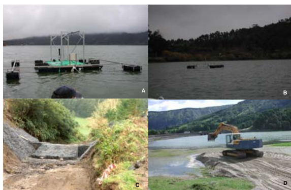
Figura 3 – Medidas de intervenção na massa de água (sistema experimental de precipitação interna de fósforo, A, e sistema de arejamento, B) e na bacia hidrográfica (açude, C, e desassoreamento das margens, D)

Agradecimentos QUERCUS – Núcleo de S. Miguel