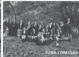
TUNA COM ELAS