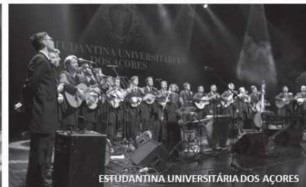
ESTUDANTINA UNIVERSITÁRIA DOS AÇORES

Considerando a sua dimensão, a Universidade dos Açores é uma das instituições mais ricas em grupos musicais no panorama nacional.