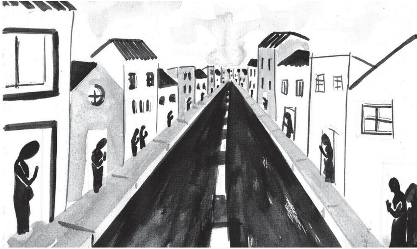
ILUSTRAÇÃO DE CARLA MEDEIROS (ANTIGA ALUNA DO Mestrado em Pré-PRI da FCSH)