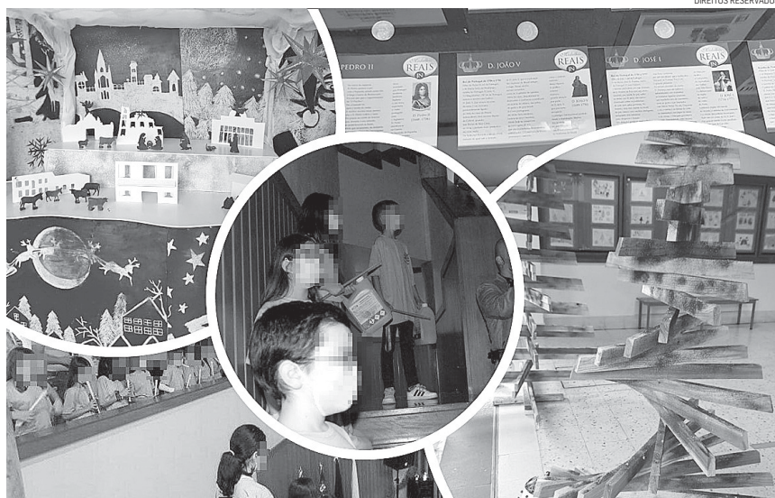
O estudo tem como público alvo crianças e jovens do concelho da Ribeira Grande, explica o autor.

No referido estudo, o conceito de cultura está relacionado com o modo de viver de um determinado grupo de pessoas, inseridas numa comunidade (Pires, 2006), manifestando-se ao longo da vida, com base nas vivências sociais (Martins, 2012). Por sua vez, a consciencialização da identidade surge quando a pessoa se confronta com contextos diferentes, estando ligada a aspetos afetivos e à construção dos novos significados culturais (Almeida, 1995). Através da educação, o ser humano aprende a relacionar-se com os outros e a conhecer a realidade social e cultural, estabelecendo partilhas e aprendizagens (Delors, 1998),