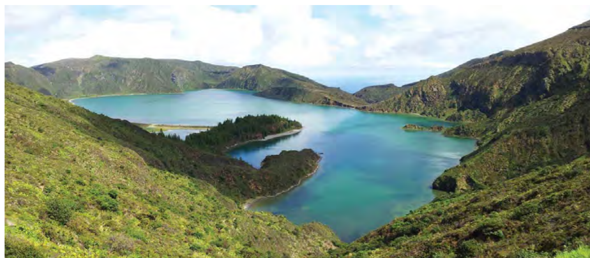
Figura 1. Caldeira do Vulcão do Fogo

Com início no final de 2016 e ainda a decorrer, o projeto tem como objetivo avaliar o impacto de uma erupção vulcânica explosiva nos principais setores económicos da região, tendo em vista a definição dos parâmetros e medidas de mitigação adequadas à preparação de Planos Especiais de Emergência de Proteção Civil para o risco vulcânico nos Açores, um tipo de instrumento que não existe na região e que é indispensável ao seu desenvolvimento sustentável. Neste contexto, o vulcão selecionado para o estudo foi o Vulcão do Fogo (Água de Pau), devido à sua localização na parte central da ilha de São Miguel, que nos últimos 5000 anos foi palco de uma erupção de estilo Pliniano, conhecida como erupção do Fogo A, e pelo menos cinco erupções de estilo sub-Pliniano, a mais recente das quais em período histórico, no ano de 1563. Assim, realizaram-se simulações de cenários eruptivos explosivos neste vulcão: um cenário mais provável, correspondente a uma erupção sub-Pliniana, semelhante à erupção de 1563, e o pior cenário possível, referente