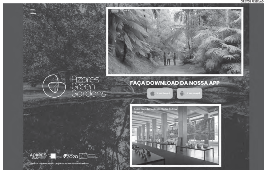
Aceite o nosso convite e venha conhecer a magia dos Jardins Históricos dos Açores

Com o objetivo de resgatar do esquecimento lugares de perpetuação e renovação da relação com a natureza, está patente na Biblioteca Nacional, em Lisboa (18-6-2020 a 21-3-2021) a exposição JARDINS HISTÓRICOS DE PORTUGAL. MEMÓRIA E FUTURO. Preparada pela AJH e integrada no conjunto de iniciativas da Lisboa Capital Verde