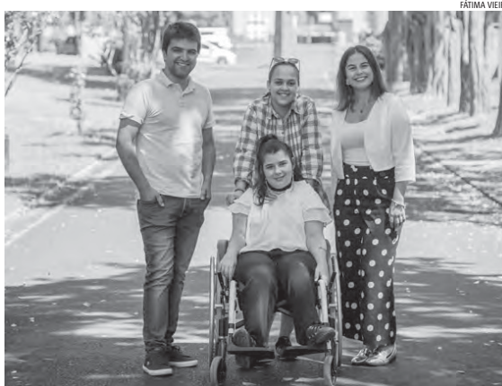
Os estudantes são acompanhados, a vários níveis, durante todo o ano letivo

to destes estudantes ao longo do ano letivo, através de reuniões com os próprios, com os responsáveis das unidades orgânicas e respetivos docentes, assim como com outras estruturas implicadas, para análise da implementação das orientações, da adaptação dos estudantes ao processo ensino/aprendizagem, de dificuldades com que se deparam, entre outras situações consideradas pertinentes. Para a inclusão