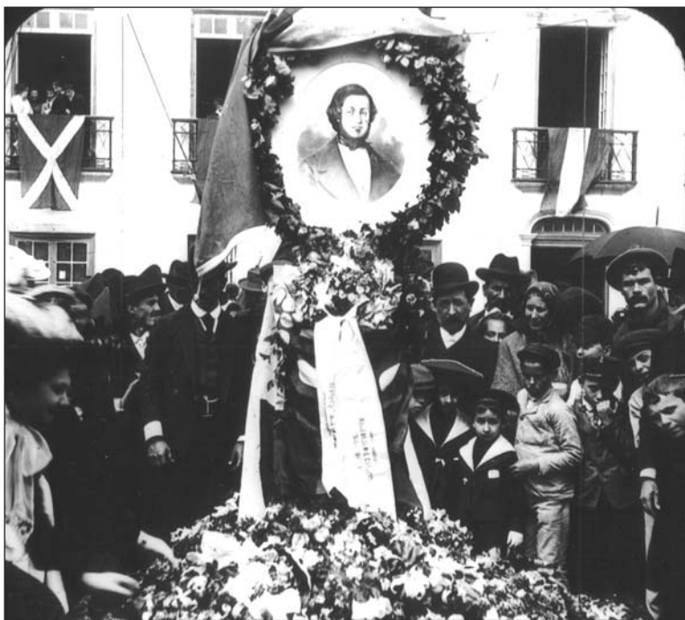
Horta, Faial, 1903. 7

Um século passado sobre estas palavras de Teófilo, longe vão os tempos de militância cívica em que as comemorações transvasavam dos saraus literários e sessões académicas, saindo à rua em manifestações públicas de carácter processional que, no sentido mais literal do termo (como podemos observar neste interessante cliché captado na cidade da Horta), traduzem a sacralização do escritor como símbolo incontestado da comunidade nacional.