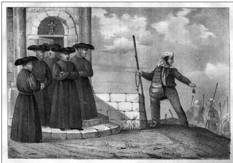
Os Romeiros de São Miguel 18

Inscrevem-se numa estratégia caracteristicamente romântica de regeneração da Literatura nacional, que assentará na valorização, recolha e fixação das histórias contadas na linguagem do povo, conforme Garrett fez no Romanceiro que, como é sabido, recompilou durante a sua estadia de dois meses na cidade de Angra em 1832: "Foi o caso que umas criadas velhas de minha mãe, e uma mulata brasileira de minha irmã, apareceram sabendo vários Romances que eu não tinha, e muitas variadas lições de outros que eu sim tinha, porém mais incompletos. Assim se aditou copiosamente o meu Romanceiro ". Efectivamente, os Açores eram terreno pródigo para este tipo de recolhas e Raposo de Almeida, ele próprio filho de camponeses, com uma infância passada em Rabo de Peixe no ambiente vernáculo dos saberes populares, tinha perfeita consciência da latitude etnográfica que deveria assumir esse trabalho, cuja proposta deixa enunciada num curioso texto ensaístico intitulado Archeologia Literária e do qual não resisto a citar um excerto substancial: