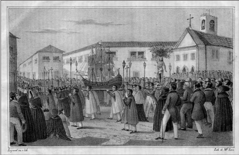
A procissão de São Sebastião em Ponta Delgada 16

1840, é o conjunto de textos aí publicados sob a epígrafe "Costumes Michaelenses", todos eles admiravelmente ilustrados com estampas apenas possíveis de reproduzir na melhor casa litográfica da capital, a dos senhores Lopes e Manuel Luis, como o próprio Raposo de Almeida faz questão de realçar.