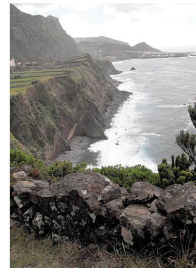
Imagem da Fajã Grande na ilha das Flores, uma ilha classificada como Reserva da Biosfera pela UNESCO

https://earthcheck.org/news/2019/december/the-azores-the-worlds-first-certified-archipelago/ ), atribuído a 5 de dezembro de 2019 pelo Conselho Global de Turismo Sustentável (GSTC – acrónimo em inglês). Este selo distintivo de qualidade no sector do turismo, e que foi pela primeira vez atribuído a um arquipélago, traz inúmeros benefícios para a região em termos de promoção do destino Açores, mas acarreta igualmente responsabilidades para os empresários locais e administração pública regional, no sentido de manter boas práticas que permitam a sua manutenção. A equipa da Universidade dos Açores envolvida no projeto, tem desenvolvido na região inúmeras pesquisas sobre os impactos do turismo no meio ambiente e o valor dos