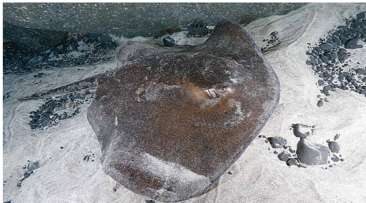
Figura 1. Ratão

Estas espécies são particularmente susceptíveis de acumular níveis alarmantes de poluentes nos seus tecidos, tendo em conta o seu elevado nível trófico e as suas características intrínsecas, que estão principalmente relacionados com a dieta, tais como poluentes orgânicos persistentes ou metais pesados como o arsénio (As), o cádmio (Cd), o mercúrio (Hg)