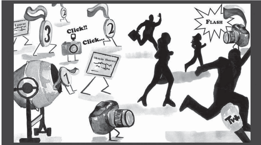
ILUSTRAÇÃO DE CARLA MEDEIROS (ESTUDANTE DO MESTRADO EM PRÉ-RI DA FCSH)

Abaixo as medalhas... "entregue-se a cada galardão uma betoneira"