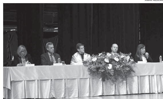
Cerimónia comemorativa do 42.º aniversário da UAc