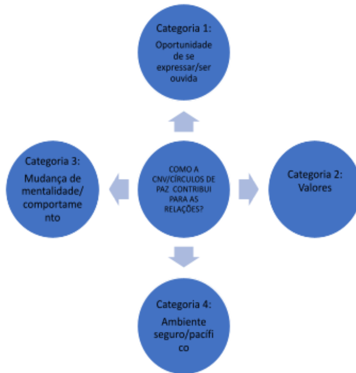
Figura 1 - Categorização

explicando-as e justificando-as. Essas categorias foram a base do tratamento da informação recolhida e da subsequente apresentação dos resultados e respectivas discussões dos mesmos.