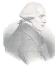
Pierre Simon Laplace