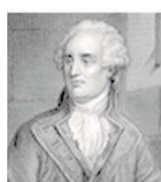
Marie Jean Condorcet