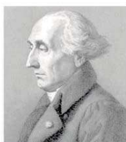
Joseph Louis Lagrange