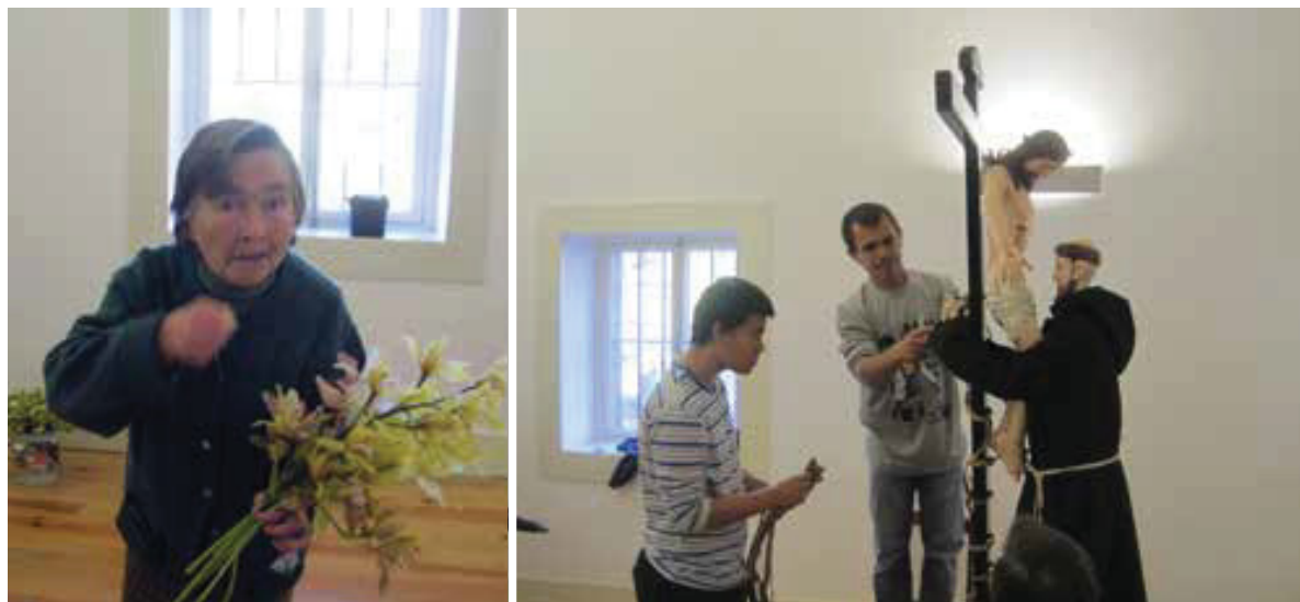
Fig. 3 – Preparação do S. Francisco abraçado à Cruz, no Convento de S. Bernardino.