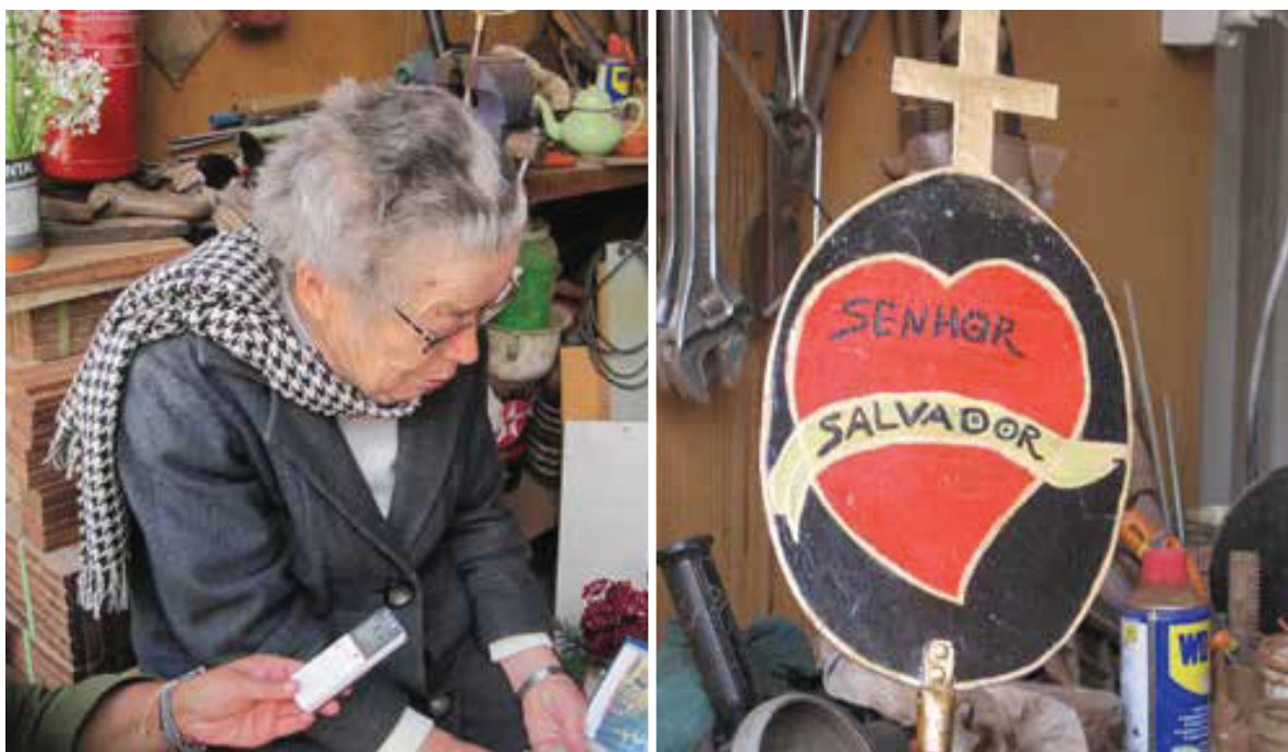
Fig. 6- Entrevista a D. Judite, antiga guardiã da imagem de São Salvador.

conjunto, colhiam as flores e faziam a decoração. Hoje, as flores são encomendadas a estufas ou lojas da especialidade, que fazem a entrega ao domicílio. Em quase todos os casos, a colocação das flores está a cargo das mulheres da família. Sucede, por vezes, situações em que as flores são pagas por alguém (familiar ou vizinho) no cumprimento de uma promessa.