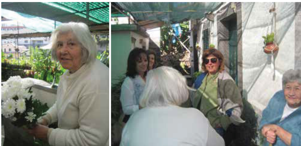
Fig 1- A preparação do São Benedito para a procissão