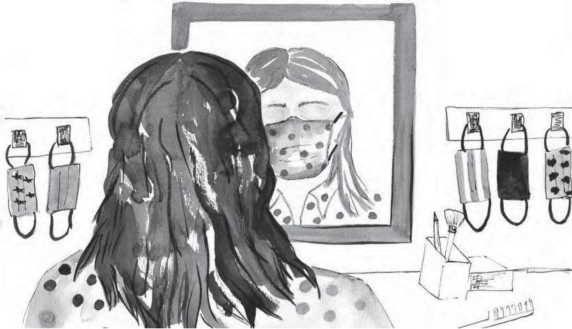
ILUSTRAÇÃO DE CARLA MEDEIROS (ANTIGA ALUNA DO MESTRADO EM PRÉ-PROFI DA FCSH)