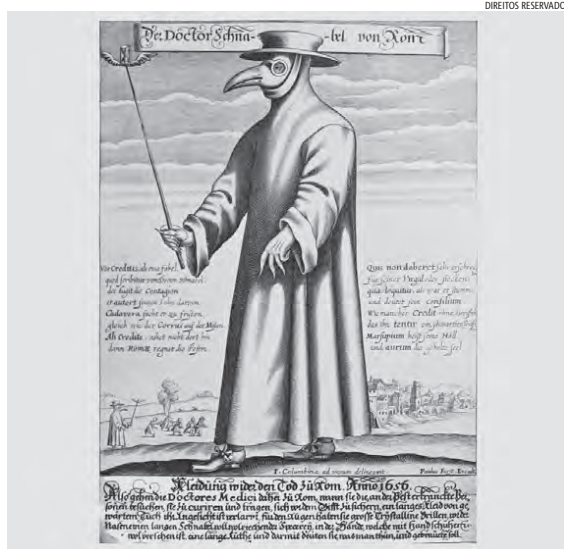
Médico da "peste negra", pintura de Paul Furst (1656).

Os últimos tempos têm sido desconcertantes, até fruto do inimaginável, para o pensamento comum. Poucos tinham vivido fenómenos de propagação grave de doenças. É certo que a recente pandemia do vírus H1N1 provocou a morte de 203 mil pessoas. Ainda antes, seria de invocar a