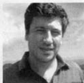
Por: João Cabral