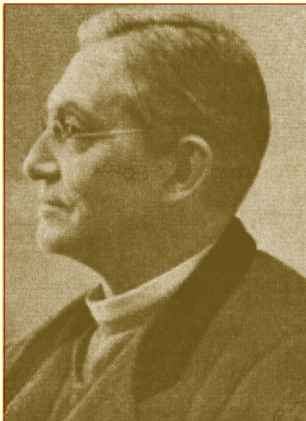
↪ José Joaquim de Sena Freitas (1840–1913) ↩