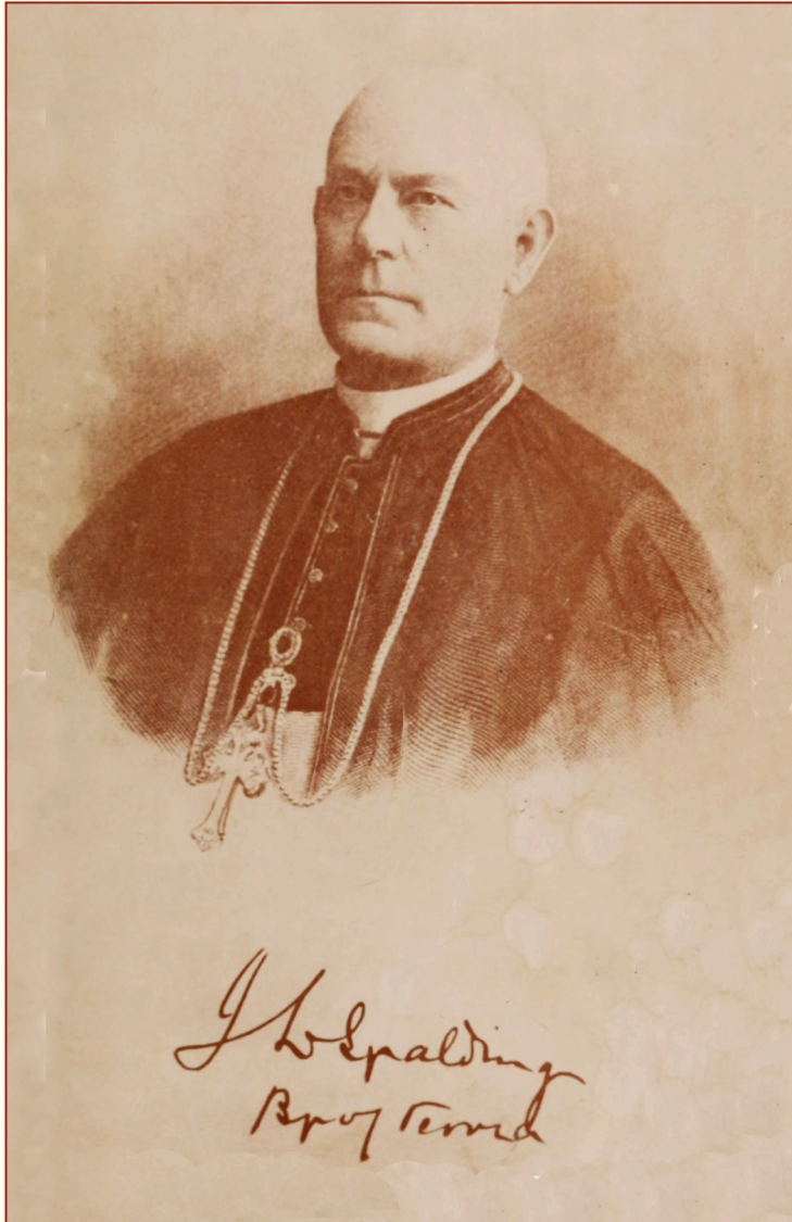
↪ John Lancaster Spalding (1840–1916) ↩