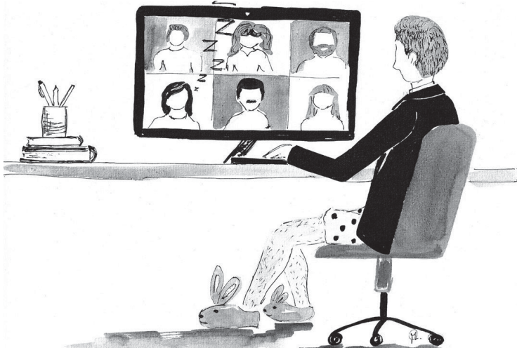
ILUSTRAÇÃO DE CARLA MEDEIROS (ANTIGA ALUNA DO Mestrado em Pré-PRI da FCSH)

Todos olham em frente, mas quem observa quem?