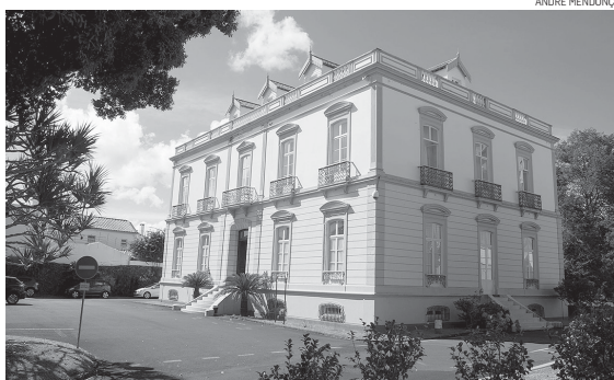
As aulas recomçam a 4 de outubro.

vo já está em andamento. Parte importante dessa preparação é a fixação do calendário letivo para 2021-2022. Assim, para o Ensino Universitário, podemos já contar com o início das aulas a 4 de outubro, com o primeiro semestre a terminar a 28 de janeiro de 2022 e o segundo semestre a ter lugar de 7 de março a 24 de junho. As férias de Natal decorrerão de 20 a 31 de dezembro; as de Carnaval de 28 de fevereiro a 2 de março e as da Páscoa de 11 a 18 de abril. Quanto a épocas de exame, e como já é habitual, as do 1.º se-