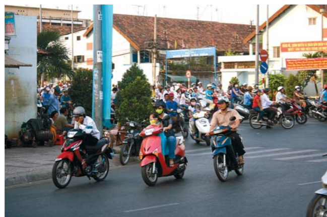
Figura 1. Trânsito na cidade de Ho Chi Minh (Vietnam)

moleculares, celulares, fisiológicos, entre outros - para avaliar o impacto dos fatores ambientais (e.g. poluentes do ar) sobre a saúde das populações, humanas ou não. O Grupo de Investigação em Saúde Ambiental e Ecotoxicologia do Departamento de Biologia, o CVARG, e o GBA, da Universidade dos Açores, têm vindo a desenvolver investigação científica com vista à identificação e determinação de novos biomarcadores de exposição e de efeito relacionados com a exposição a poluentes do ar. Um dos biomarcadores desenvolvidos e utilizados pelo grupo em programas de biomonitorização da qualidade do ar, são os defeitos que ocorrem no núcleo das células que revestem a cavidade bucal. Estas células têm um tempo de vida de cerca de 10 dias desde a sua origem na zona mais profunda do tecido, até morrerem e se libertarem à superfície na cavidade bucal (Figura 3). Durante todo o processo mitótico (reprodução celular) e durante toda a diferenciação celular, rumo à superfície, as células estão particularmente suscetíveis à influência nefasta dos xenobióticos (e.g. poluentes do ar), que se manifesta em vários tipos de anomalias nucleares