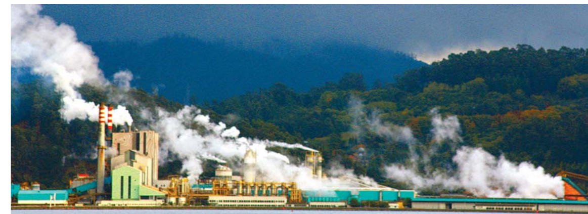
Figura 2. Fábrica de celulose em Pontevedra (Espanha)

visíveis ao microscópio. Os tipos de anomalias nucleares e a frequência com que ocorrem representam a resposta daquele tecido, e do indivíduo, à exposição a uma determinada carga e tipologia de poluentes do ar, constituindo assim biomarcadores de efeito.