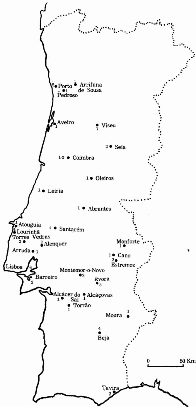
Mapa 1 — Representação, por localidades, do número de cartas, equiparando ou mantendo privilégios a aposentados, vassallos, besteiros e outros.