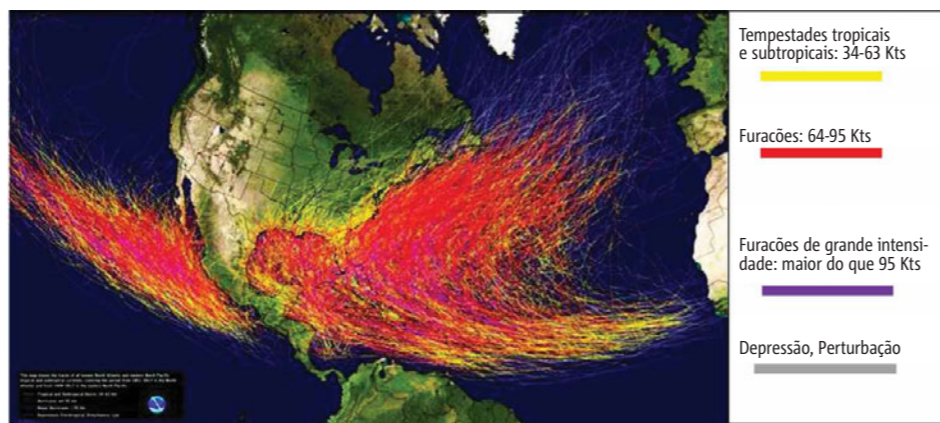
Figura 2 – Trajetórias dos ciclones tropicais – Desde 1949 no Pacífico e desde 1851 no Atlântico Norte

nidas as condições propícias para que os furacões venham ao longo do tempo ganhando mais energia, tornando-se mais fortes. Em suma, a intensificação dos fenómenos ocorre devido ao facto de estarmos a viver em um clima globalmente mais quente, como resultado da alteração antropogénica da composição da atmosfera. O conhecimento da velocidade de translação destes fenómenos é um recurso importante para as medidas de prevenção, porque quanto mais lentos os ciclones tropicais se movem, maior será o tempo de influência sobre uma determinada área, resultando em um impacto mais severo. Segundo um