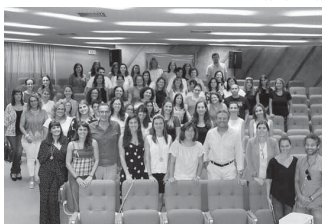
Intervenção Psicossocial em debate num workshop bastante participado