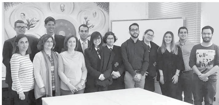
NEHPUA, Núcleo de Estudantes de História e Património