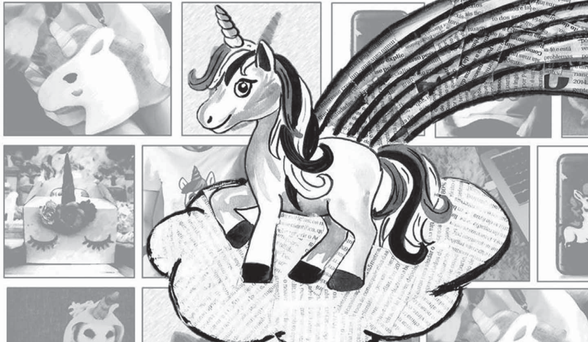
ILUSTRAÇÃO DE CARLA MEDEIROS (ANTIGA ALUNA DO MESTRADO EM PRÉ-PRÍ DA FCSH)

Dedicado a tod@s os que sonham ganhar asas e regressar à juventude!