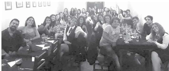
NEPSIC, Núcleo de Estudantes de Psicologia