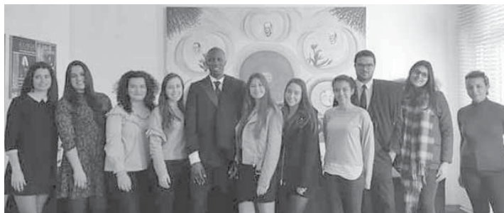
NESSUA, Núcleo de Estudantes de Serviço Social