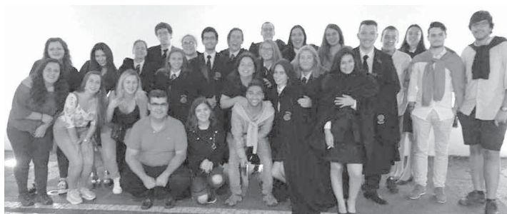
NESUA, Núcleo de Estudantes de Sociologia