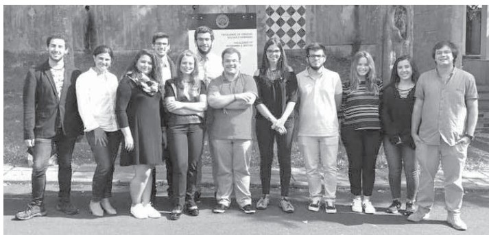
NEEA, Núcleo de Estudantes de Estudos Euro-Atlânticos