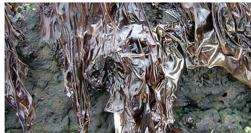
Figura 2. Porphyra, a “erva patinha” usada nas Flores e Corvo para confeccionar tortas.