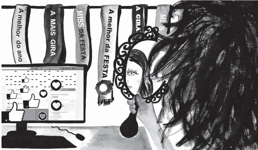
ILUSTRAÇÃO DE CARLA MEDEIROS (ANTIGA ALUNA DO MESTRADO EM PRÉ-PRÍ DA FCSH)

Miramo-nos ao espelho, enquanto recebemos mais uma alfinetada nas nossas consciências