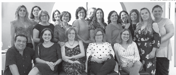
Licenciados em Ensino Básico - 1.º Ciclo comemoram 20 anos de curso