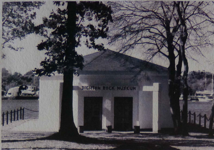
Celebração dos 500 anos da presença açoriana na América do Norte, Massachusetts, EUA

Os Açores, pela qualidade de vida que oferecem, começam a definir-se como potencial espaço para fixação temporária ou não de jovens açor-descendentes que nos visitam e se surpreendem com as ilhas.