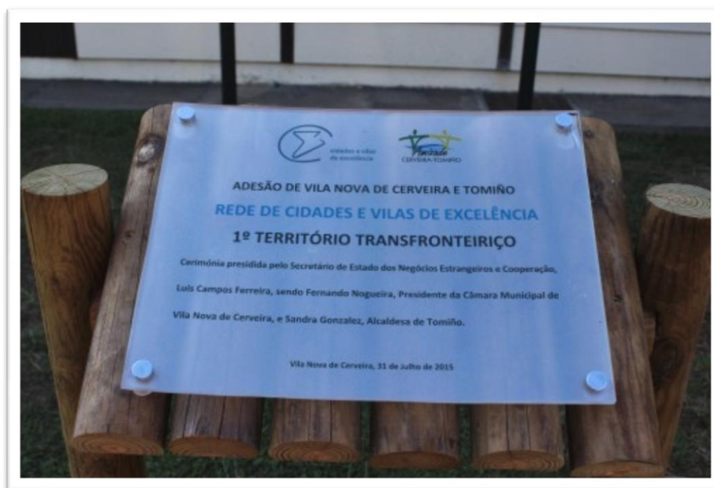
Figura 4 - Placa Comemorativa de Instituição a Vila de Excelência.

vetores chaves na sua estratégia de desenvolvimento e afirmação territorial. É um bom exemplo a ser seguido, dadas as potencialidades do concelho de Vila Franca do Campo, e do projétil que esta denominação beneficiaria ao concelho.