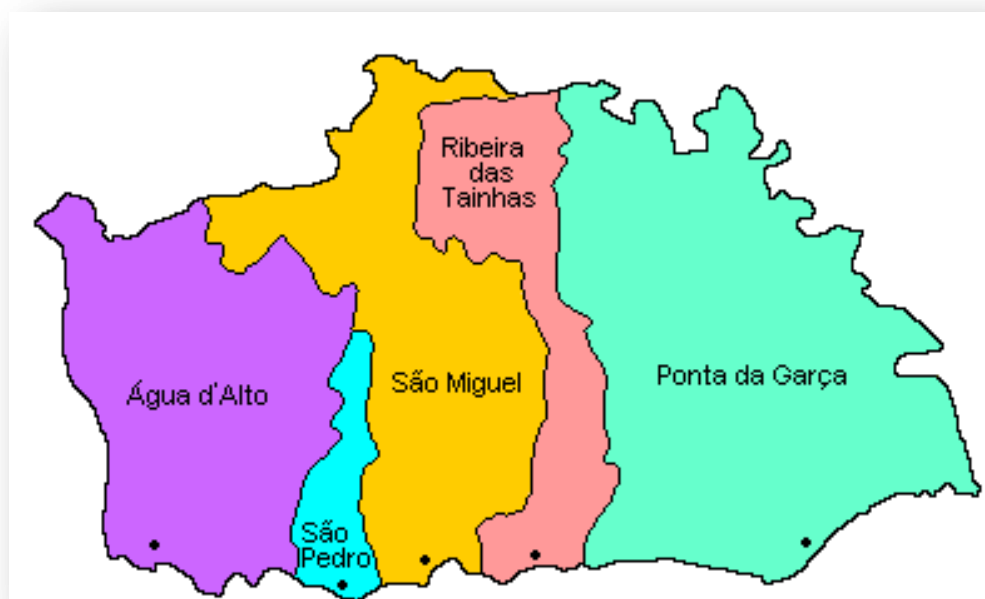
Figura 2 - Mapa do Concelho de Vila Franca do Campo

A primeira capital dos Açores, Vila Franca do Campo, hoje apresenta pouca ou nenhum registo físico da sua idoneidade. Historicamente, esta foi sempre uma terra de elites letradas. Importa fazer um levantamento aprofundado das personalidades, dos acontecimentos que aqui se passaram para promover a sua valorização através do turismo.