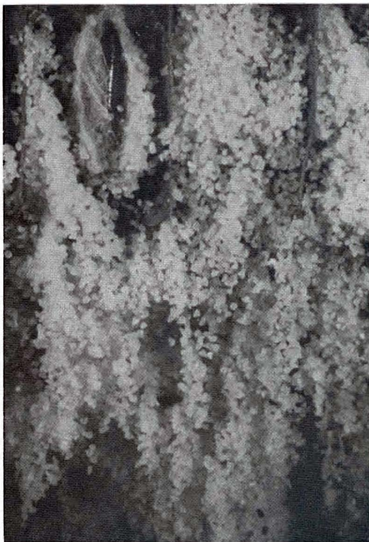
Fig. 3 — Nymphe d' Ephestia kuehmella sur le carton et dans le cocon.