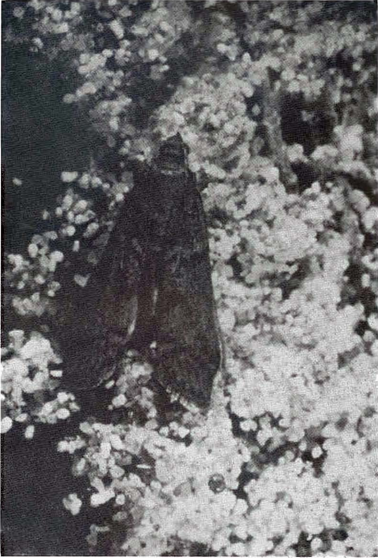
Fig. 1 — Adulte d' Ephestia kuehniella ZELLER.