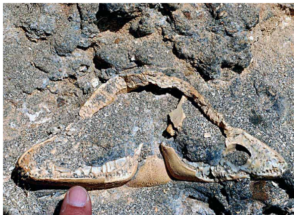
Fig. 3 - Clypeaster altus , um ouriço-do-mar com cerca de 4-5 milhões de anos. Jazida da falha oeste da Malbusca.

Em 1996, a Associação Internacional de Paleontologia insti-