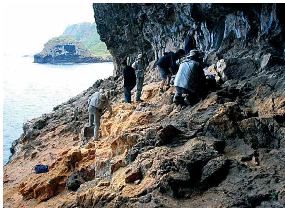
Fig. 2 - Trabalho de campo na jazida da Ponta do Cedro, durante o 11º workshop internacional “Paleontologia em Ilhas Atlânticas”, Junho de 2014.

Em ecossistemas lacustres, no interior dos sedimentos depositados nos fundos das lagoas, existem restos fossilizados de pólenes e de esporos, bem como de pequenos invertebrados (cladóceros, e quironómídeos – pequenas moscas dípteras) e de protistas (diatomáceas – organismos unicelulares),