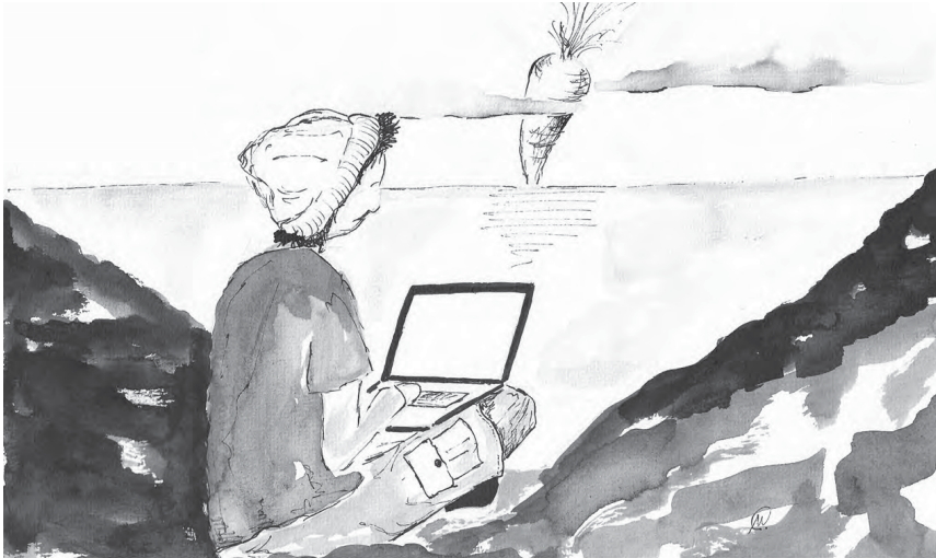
ILUSTRAÇÃO DE CARLA MEDEIROS (ANTIGA ALUNA DO MESTRADO EM PRÉ-PRÍ DA FCSH)

Uma cenoura como horizonte, num qualquer lugar do mundo!