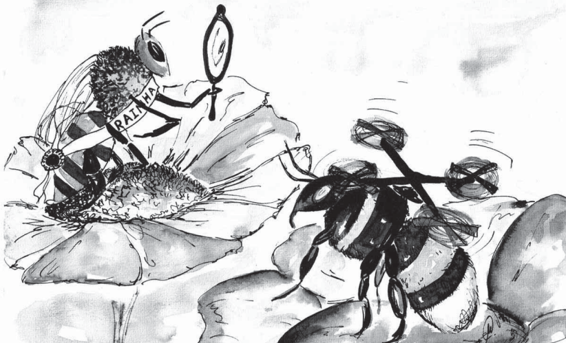
ILUSTRAÇÃO DE CARLA MEDEIROS (ANTIGA ALUNA DO MESTRADO EM PRÉ-PRÍ DA FCSH)

“Qualquer semelhança entre este invento e o macho da colmeia não passa de mera coincidência”.