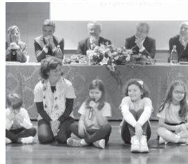
A cerimónia de entrega realizou-se no passado dia 10 de março.

ESCOLA BÁSICA E SECUNDÁRIA ARMANDO CÔRTESE-RODRIGUES