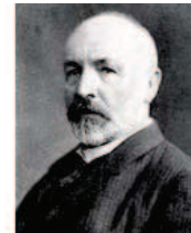
Cantor Pai da Teoria dos Conjuntos