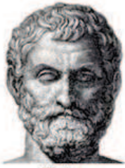
Tales Pai da Geometria Descritiva