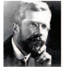
Fisher Pai da Estatística