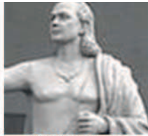
Brahmagupta Pai da Aritmética da Álgebra da Análise Numérica