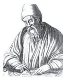
Euclides Pai da Geometria