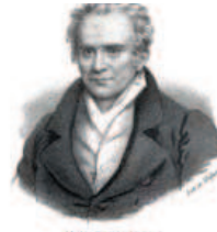
Monge Pai da Geometria Diferencial