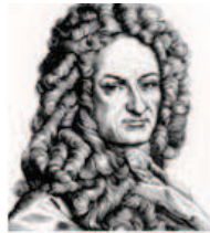
Leibniz Pai do Cálculo Diferencial e Integral