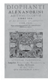
Diofanto Pai da Álgebra