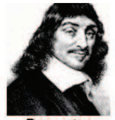
Descartes Pai da Geometria Analítica