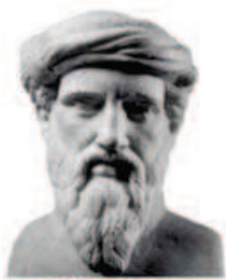
Pitágoras Pai da Matemática