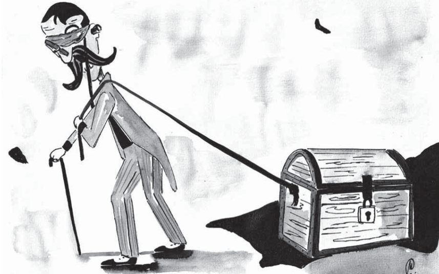
ILUSTRAÇÃO DE CARLA MEDEIROS (ANTIGA ALUNA DO MESTRADO EM PRÉ-PROF DA FCSH)

Oh, Eça! Emigra de vez! Já ninguém aprende nada contigo.