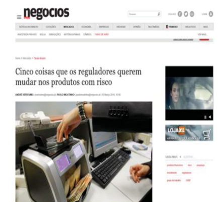
Figura 1- Notícia: 5 coisas que os reguladores querem mudar nos produtos com risco

A venda de produtos financeiros nos últimos meses tem sido frequentemente primeira página e notícia dos mais diversos jornais portugueses e internacionais. Este tema tem sido fortemente escrutinado no seio da vida política, económica e social. A atestar isso mesmo é o artigo de 5 de março de 2016 do Jornal de Negócios: