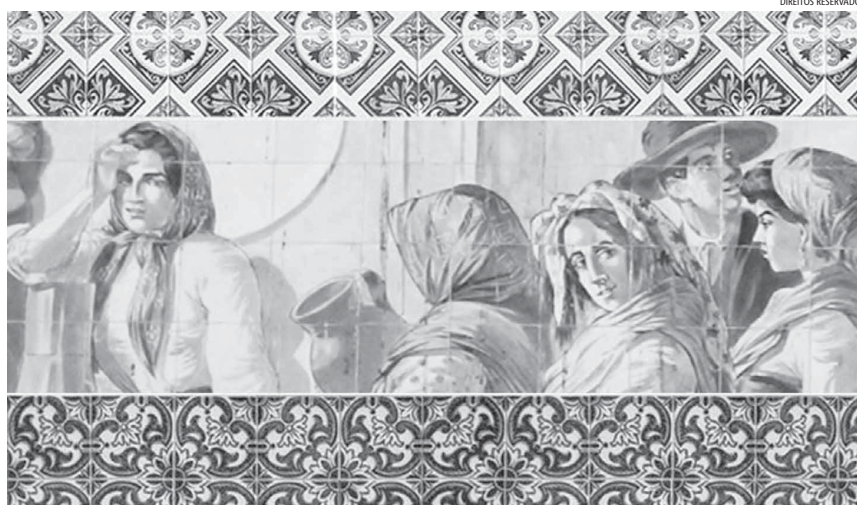
"A imagem da Mulher nos Adagiários portugueses é tendencialmente negativa", explica a autora.

Na nossa análise estatística do conhecimento dos provérbios portugueses incluídos em diversas coletâneas do século XX, verificámos que nem 1% dos cerca de 750 exemplares que referem a Mulher são reconhecidos pela maioria da população. Em São Miguel, apenas cinco desses provérbios são relevantes: A mulher e a sardinha a mais pequenina; Entre marido e mulher não metas a colher; Livre-nos Deus do poder da má mulher; Não se deve bater na mulher nem com uma flor; O homem faz a mulher e a mulher faz o homem. Os outros exemplares ou nunca tiveram realmente um estatuto popular ou já o perderam devido à consciência da importância social, económica, cultural e política da metade feminina da humanidade. Relativamente aos exemplos apre-