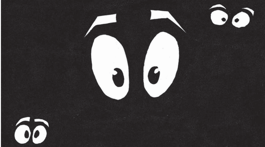
ILUSTRAÇÃO DE CARLA MEDEIROS (ANTIGA ALUNA DO MESTRADO EM PRÉ-PRÍ DA FCSH)

“O importante é fingir que se está a adorar a experiência.”