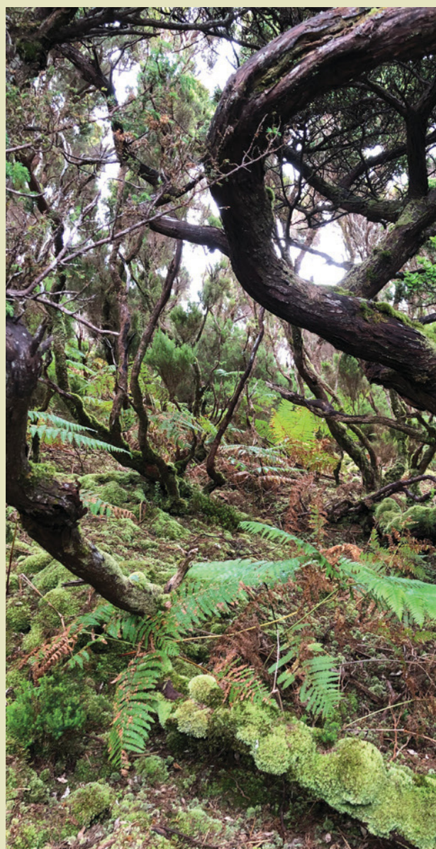
Floresta natural na Terceira (Trilho das Bestas) (RG - 2022, Julho.)

[A natureza] não se aprende: vive-se! (AO-077)