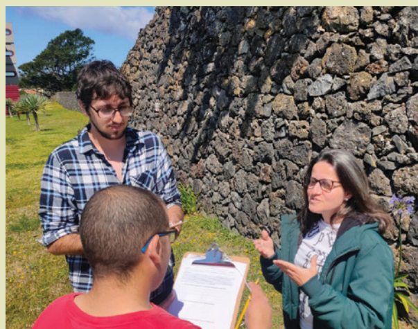
Os investigadores AOB e VRL apresentam o questionário a um voluntário na Freguesia de São Pedro (Angra do Heroísmo).

Participaram no estudo 155 residentes na Ilha Terceira, 94 do concelho de Angra do Heroísmo e 61 da Praia da Vitória. Destes, 93 são do sexo feminino e 62 do sexo masculino, com idades compreendidas entre os 18 e os 81 anos. A faixa etária mais representada situa-se entre os 41-60 anos (49,7%), enquanto cerca de um quarto da amostra (26,4%) é formada por pessoas com menos de 41 anos e quase um quarto (23,9%), por inquiridos com mais de 60 anos. Em termos de habilitações académicas, a maioria dos respondentes completou o ensino secundário (37,4%), seguindo-se o grupo dos que completaram o 3º Ciclo do Ensino Básico (23,2%) e 16,8% com o ensino superior. Embora neste caso a preponderância de licenciados esteja abaixo de um quinto, os dados confirmam a tendência para sobrestimar o número de pessoas com maior nível de escolaridade. A amostra também confirma a preponderância dos trabalhadores do sector terciário na ilha (68,4%), a escassa presença do sector secundário (4,5%) e a dificuldade de obter respostas de trabalhadores do sector primário (6,4%).