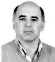
Por: Jerónimo Nunes

Docente do Departamento de Matemática da Universidade dos Açores Membro do Centro de Matemática Aplicada e Tecnologias de Informação jnunes@uaacpt