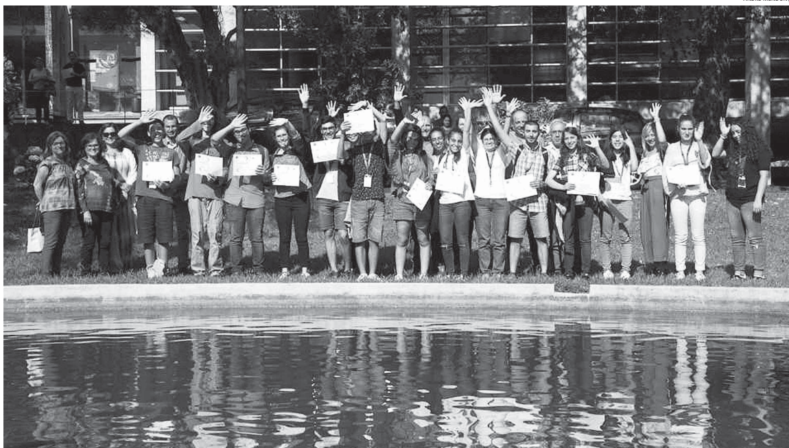
Retrato de grupo após a cerimónia de encerramento, na qual pais, docentes e representantes das autarquias, apreciaram alguns dos trabalhos dos alunos e visionaram fotografias de atividades.

Em média, quantos estudantes do ensino básico e do ensino secundário têm anualmente aderido ao Verão Jovem na UAc ?