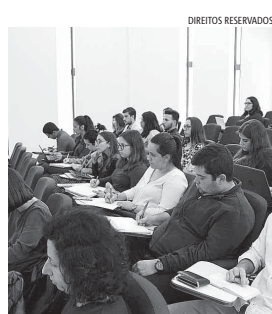
FCSH promove Workshop de Tradução.