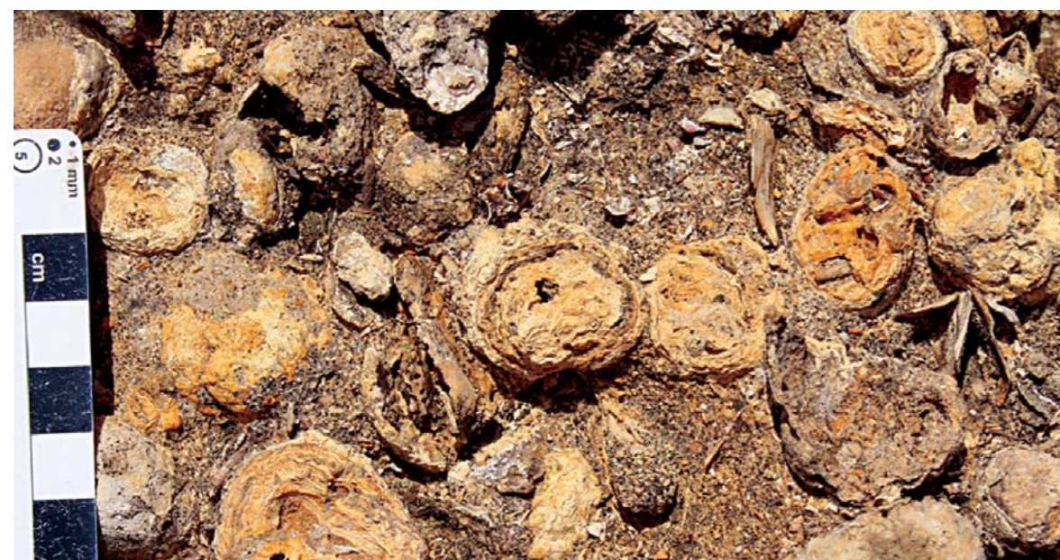
Figura 1 – Acumulação de rodólitos fósseis na jazida da Malbusca (Santa Maria). Rebelo et al. (2016)

Mas, afinal, qual a utilidade destes estudos? Qual a impor-