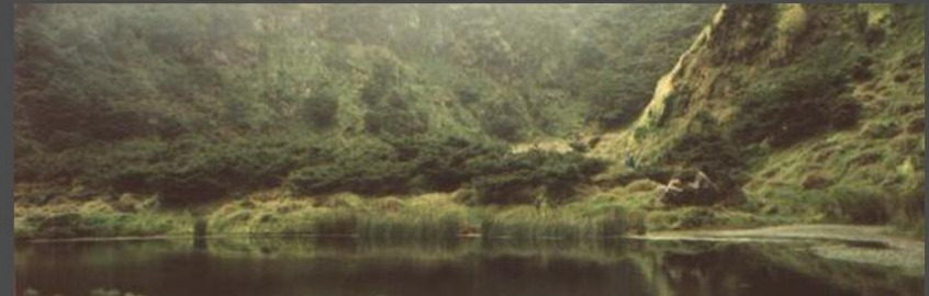
Strong attachment to the living place