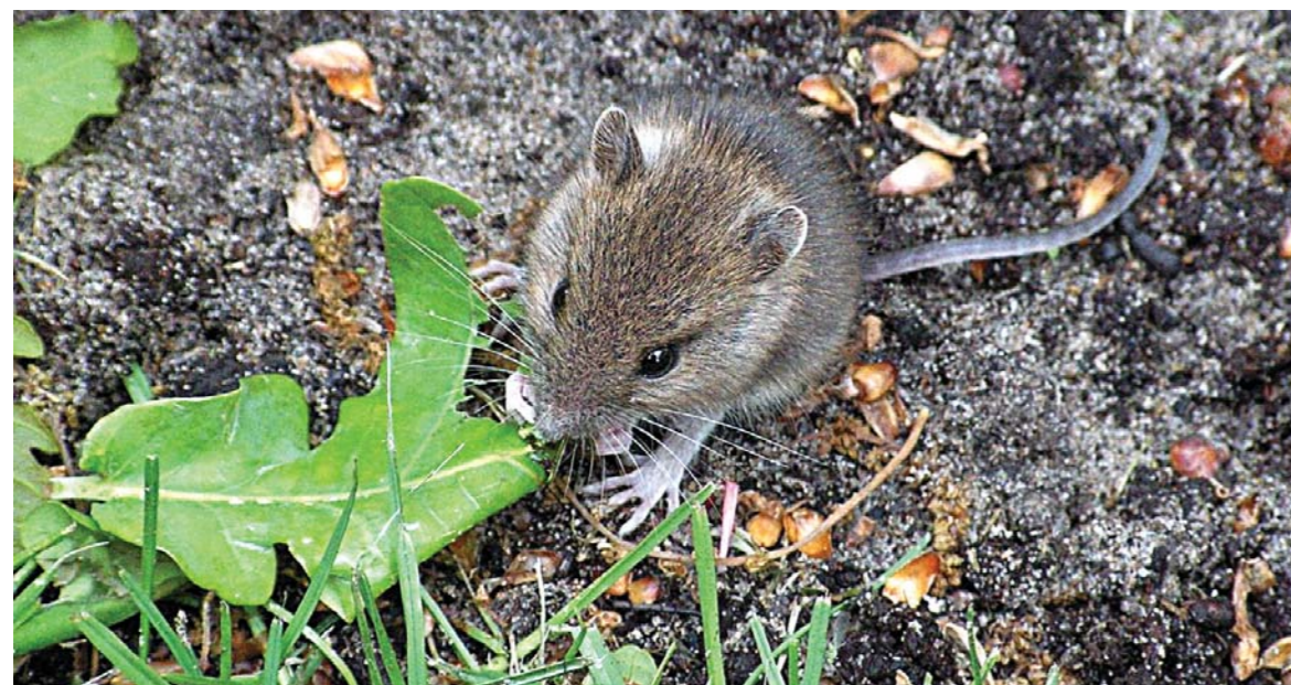
Figura 1- Exemplar de Mus musculus (murganho)

avaliação dos seus efeitos na saúde humana. Muitos destes contaminantes vão entrando no organismo e interferem com a saúde reprodutiva, alterando a produção de hormonas e, consequentemente, os processos reprodutivos que elas controlam. E, embora a legislação obrigue à realização de testes para alguns compostos, a verdade é que estas exigências referem-se a níveis muito baixos e, na “vida real”, os organismos não estão expostos a uma simples substância de cada vez mas sim a misturas que frequentemente se potenciam em toxicidade. Esta é uma das razões porque defendemos, a par de estudos laboratoriais, a realização de estudos “em situação real”, de campo. É que para a avaliação do risco de toxicidade reprodutiva temos que considerar, para além das misturas de poluentes, também o fator tempo de exposição que, em situação real, se pode prolongar por dezenas de anos, aspeto difícil de recriar e controlar em laboratório. Um fator a que geralmente se atribui pouca importância é a temperatura ambiente a que os indivíduos do sexo masculino estão expostos. A grande maioria dos mamíferos possui os testículos localizados fora da cavidade abdominal, na bolsa escrotal, o que lhes permite, a par de um sistema vascular de contracorrente, manter toda a produção de espermatozoides a temperaturas ligeiramente inferiores (35-36°C) às do resto do organismo.