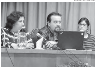
O Agora em destaque nas VIII Jornadas de Relações Públicas