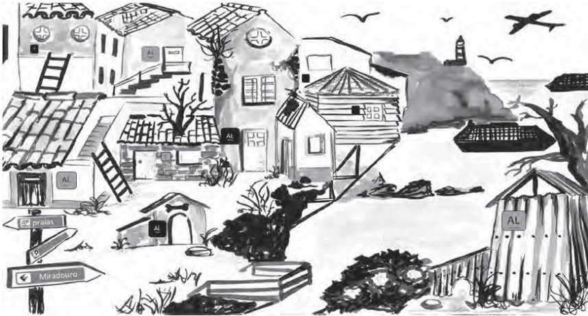
ILUSTRAÇÃO DE CARLA MEDEIROS (ANTIGA ALUNA DO MESTRADO EM PRÉ-PRÍ DA FCSH)