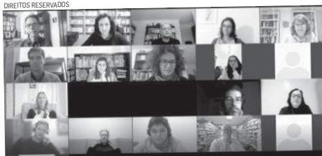
A tradução de literatura açoriana esteve em debate na UAc