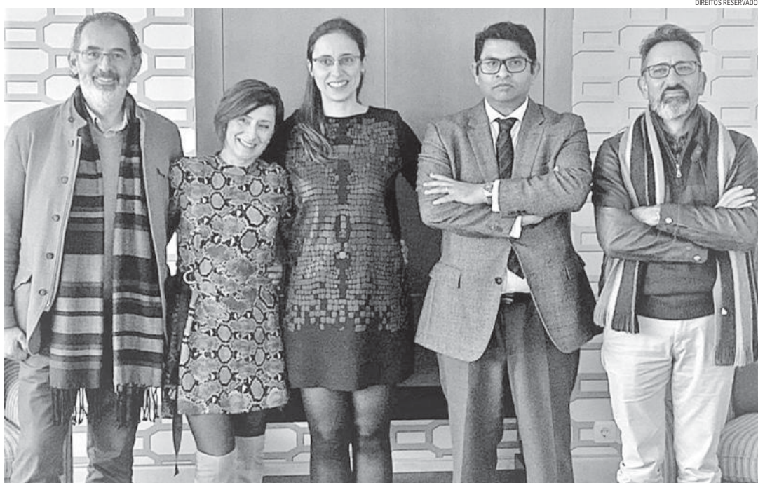
“A equipa que constitui esta CE criou, desde a primeira hora, um ambiente dinâmico de forte espírito colaborativo”.

De acordo com o Código de Ética da UAc, documento que rege a atuação da CE, existem três grandes áreas de atuação: a ética institucional, a ética académica e a ética na investigação. É sobretudo na última que se tem focado o nosso trabalho, isto é, na produção de pareceres relativos a trabalhos de investigação. Analisamos cerca de 15 pedidos de parecer por mês... na prática reunimos, em média, duas a três vezes em cada mês, consoante o volume de trabalho que temos.