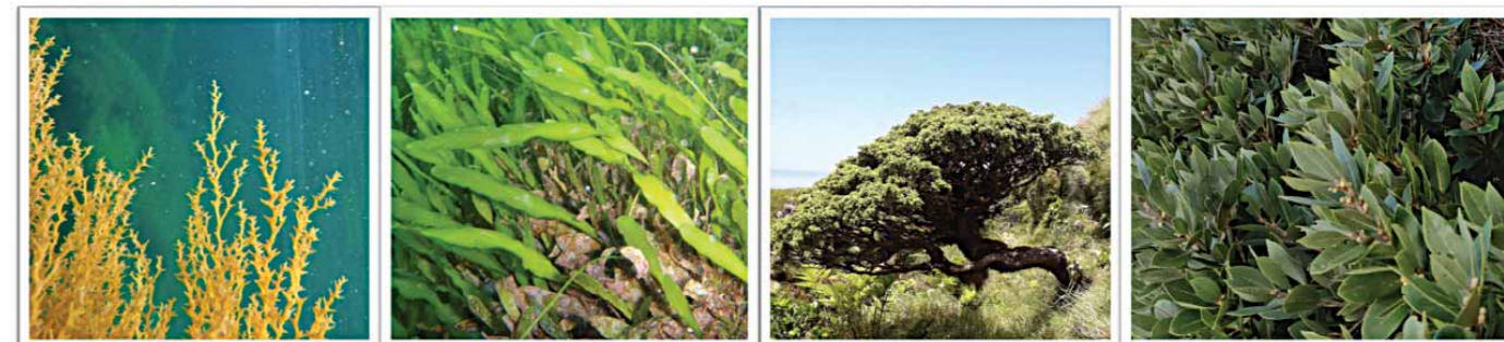
Figura 2: Plantas dos Açores cujos compostos naturais estão a ser estudados e avaliado o seu potencial farmacológico: as algas Cystoseira abies-marina e Caulerpa prolifera , e as plantas terrestres endémicas o cedro das ilhas, Juniperus brevifolia e o louro das ilhas, Laurus azorica .

por Friedrich Sertürner e comercializado pela Merck a partir de 1827, ainda antes da aspirina. Também o antibiótico penicilina, um produto natural produzido pelo fungo Penicillium notatum e descoberto por Alexander Fleming em 1929, é, como os casos anteriores, um produto natural que é um medicamento de sucesso.