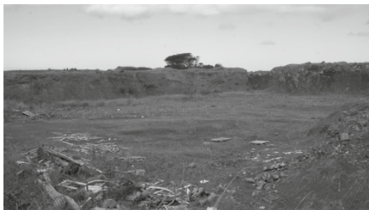
Figura 1 - Poço do Jofre, Julho de 2009.

O habitat propício para reprodução desta espécie tem sofrido redução drástica, designadamente por meio do soterramento de zonas húmidas, sem se ter em conta os possíveis impactes sobre a flora e a fauna. Isto tem ocorrido, pelo menos, em São Miguel, na Terceira (Barata, 2002) e em Santa Maria. Na última ilha cite-se o exemplo do Poço do Jofre, no qual foram detectados adultos na época de reprodução em quatro anos diferentes (1999 a 2002). Este Poço está, actualmente, seco devido à deposição de materiais de construção civil (Figura 1).