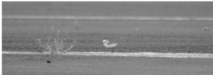
Figura 3 - Indivíduo pertencente a Charadrius alexandrinus , aeroporto de Santa Maria, Julho de 2009.

(Barata, 2002), pontualmente no aeroporto da ilha Graciosa (Medeiros, et al. , 2004) e no aeroporto de Santa Maria, onde tem nidificado regularmente (Medeiros et al. , 1990; Equipa Atlas, 2008). Assim, apesar de ser uma espécie residente com distribuição muito restrita, no arquipélago, Santa Maria alberga um dos melhores locais de reprodução desta espécie nos Açores. O outro local é o Paul do Cabo da Praia que foi identificado por Barata (2002) como uma área importante para aves, a nível regional.