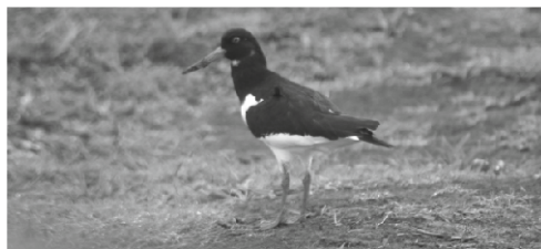
Figura 4 - Indivíduo pertencente a Haemantopus ostralegus , Julho de 2009.

A figura 4 mostra um indivíduo pertencente a Haemantopus ostralegus avistado na Praia Formosa. Bannerman e Bannerman (1966) referem a ocorrência de exemplares nos Açores desde o início do século XX, o que se tem verificado até à actualidade (Rodebrand, 2010).