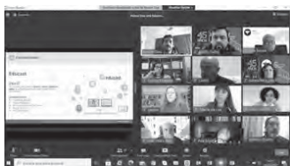
Os docentes da UAc experimentam as ferramentas do portal EDUCAST