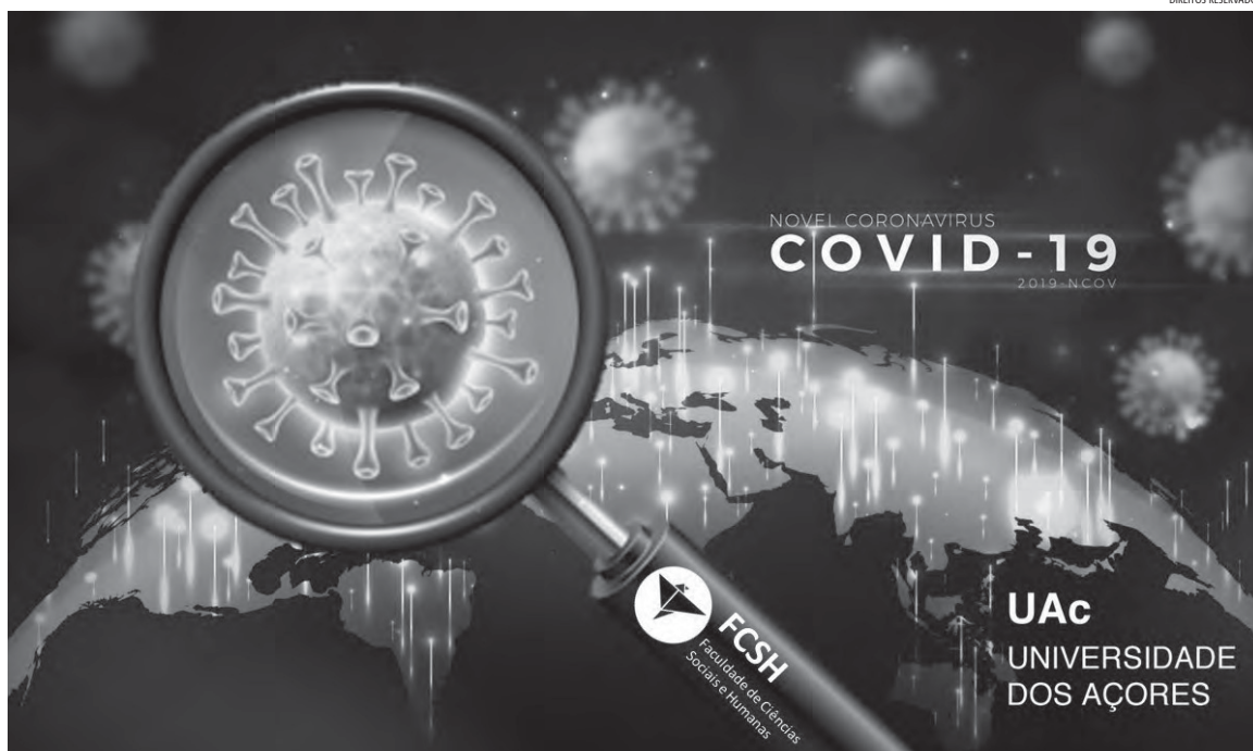
A COVID-19 tem estado na mira das investigações dos docentes da FCSH.