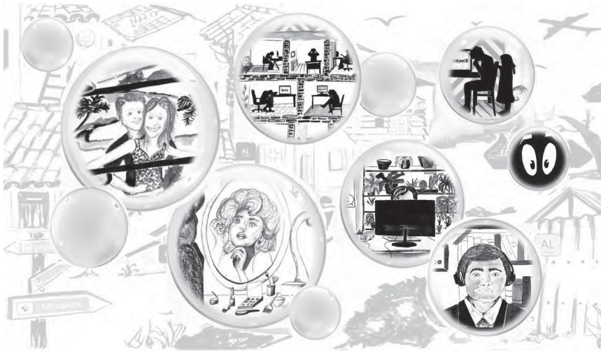
ILUSTRAÇÃO DE CARLA MEDEIROS (ANTIGA ALUNA DO MESTRADO EM PRÉ-PRÍ DA FCSH)

Deixe-se levantar e evite a colisão entre bolhas