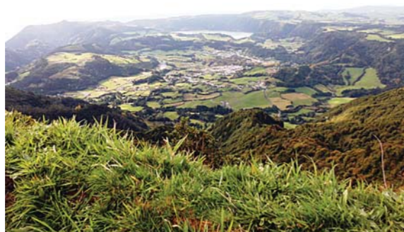
Figura 1 – Caldeira do Vulcão das Furnas

O Vulcão das Furnas corresponde a um vulcão central com caldeira (figura 1), tendo entrado em erupção pela última vez em 1630. A sua atividade eruptiva tem apresentado um carácter essencialmente explosivo, emitindo material de natureza traquítica (s.l.). Embora a maioria da sua atividade eruptiva se desenvolva no interior da caldeira, onde ocorreram pelo menos 10 erupções nos últimos 5000 anos, foram ainda identifica-