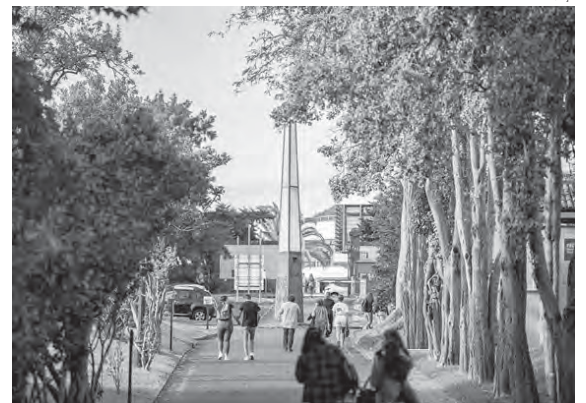
Estudar na FCSH-UAc num ano marcado pela pandemia...