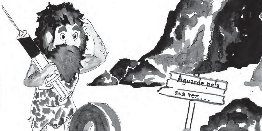
ILUSTRAÇÃO DE CARLA MEDEIROS (ANTIGA ALUNA DO MESTRADO EM PRÉ-PRÍ DA FCSH)