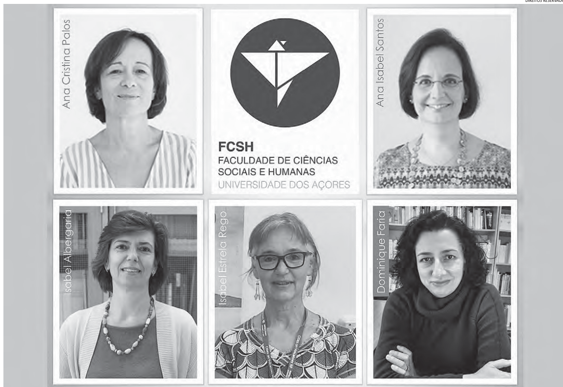
Olhares das atuais Coordenadoras dos diferentes departamentos desta Unidade Orgânica, cujo mandato agora termina.

É com sentido de dever cumprido e com os olhos postos no futuro que deixo a Coordenação do Departamento de Educação. Foi com um misto de alegria e tristeza que nos despedimos de quem se aposentou e que passámos a encontrar-nos à distância, mas os obstáculos não nos impediram de continuar a trabalhar em prol do Departamento, da FCSH e dos nossos estudantes. Assim, voltámos a ver acreditados a Licenciatura em Educação Básica e o Mestrado em Educação Pré-Escolar e Ensino do 1.º C.E.B., deixamos em avaliação o Mes-