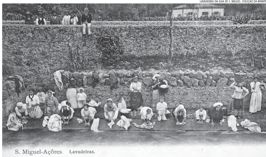
S. Miguel-Açores. Lavadeiras.

Este projeto de investigação em Ciências Sociais e Humanas, centra-se, preferencialmente nas ilhas de S. Miguel e Terceira e tem como objetivo efetuar um levantamento das atividades profissionais desempenhadas por mulheres, ao longo de um período de profundas transformações (últimas décadas da Monarquia e Primeira República). Integrado nos Estudos de Género, articulados com a História Económica e Social, permitirá destacar figuras e papéis femininos, bem como o seu contributo para o incremento económico-social e cultural das ilhas. Através do cruzamento de diferentes fontes arquivísticas (imprensa, relatos de viagens, opúsculos, cartas, fotografias), pretende-se ainda analisar questões de (des)igualdade de género, concorrendo para um novo olhar sobre as dinâmicas sociais insulares, através do trabalho feminino, nem sempre correspondente aos estereótipos da domesticidade e da passividade, associados ao passado. Nas artes, nas letras, na educação; no comércio e na restauração; na saúde ou no jornalismo, em áreas tidas como pouco femininas, contam-se diversas mulheres açorianas, que se impõe conhecer ou (re)encontrar. Também importa relevar as muitas tecedeiras, bordadeiras,