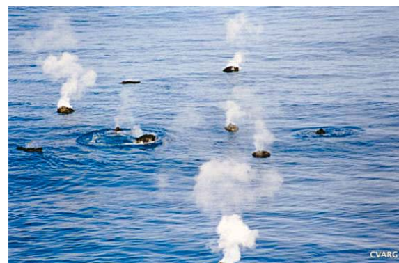
Balões de Lava a flutuar à superfície.

Mais de 75% da Terra está coberta por oceanos, impedindo a observação direta da maior parte da sua superfície. Embora a maior parte do que se sabe acerca de vulcanismo da Terra seja baseado no conhecimento desenvolvido em vulcões subaéreos, a importância global do vulcanismo submarino é indiscutível. De facto, os vulcões submarinos são responsáveis por cerca de 85% do vulcanismo da Terra e, portanto, são responsáveis por um grande impacto no planeta. Existem diferentes razões para a escassez de informação sobre vulcanismo submarino: as erupções submarinas são difíceis de detectar, a observação tem de ser feita de um local próximo da erupção e qualquer observação ou estudo destas erupções