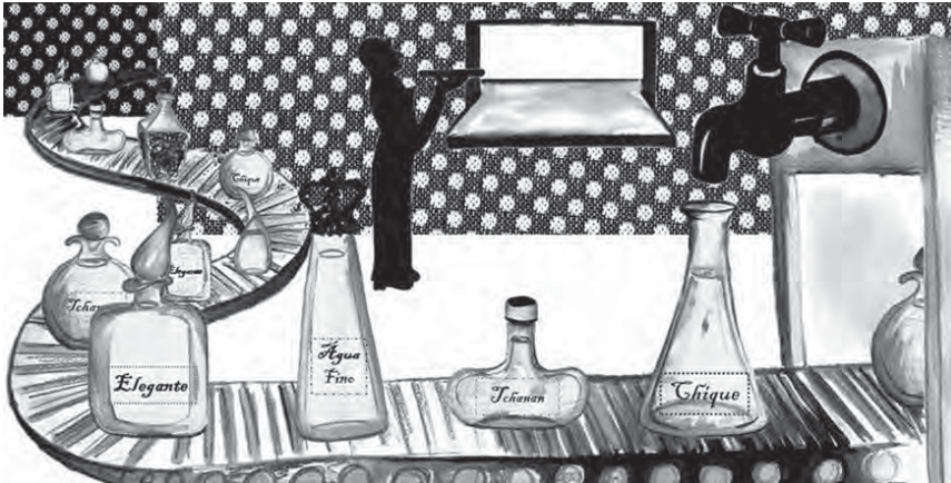
ILUSTRAÇÃO DE CARLA MEDEIROS (ESTUDANTE DO MESTRADO EM PRÉ-PROFI DA FCSH)

Abaixo as garrafas de plástico... A água "del cano" está na moda!!