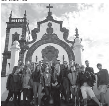
Estudantes Erasmus conhecem Ponta Delgada

trimónio e a vida das suas gentes. Gostaria, também, que no final da visita, o grupo de estudantes proveniente do leste e do norte, do centro e do sul da Europa, se reconhecessem nas suas diferenças e similitudes, entre si e perante o lugar que todos escolheram para habitar durante os próximos meses. Para nós, professores e estudantes da UAc, recebê-los bem é, não só um dever de cortesia, como ainda um sinal de inteligência social e de maturidade cultural. Bem-vindos, pois, à nossa Região e à nossa Academia!