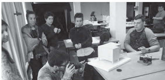
Alunos do 12.º ano descobrem as potencialidades da fotografia em Workshop promovido na UAC