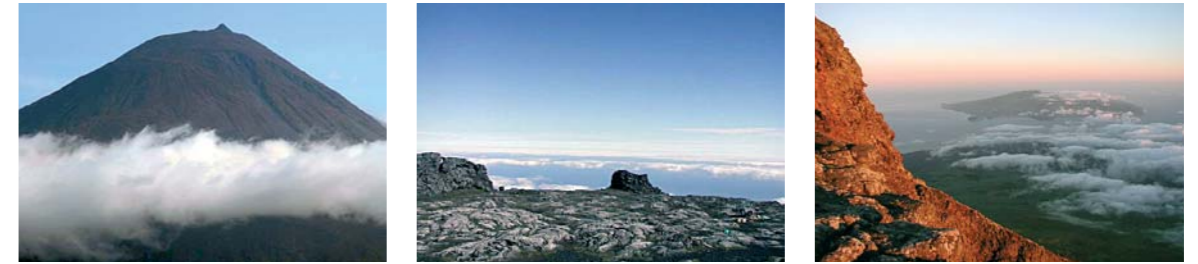
Figura 2 – Cratera no topo da montanha do Pico, acima da camada de nuvens.

As estações globais caracterizam-se por: