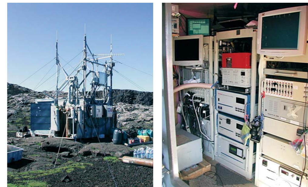
Figura 3 – Estação da montanha do Pico situada na cratera do vulcão.

Desde 2001 que a Universidade dos Açores, com o apoio do Governo Regional dos Açores, e a Universidade Tecnológica de Michigan (USA), com financiamento obtido junto de entidades norte americanas (( National Science Fundation (NSF); Department of Energy Atmospheric System Research (DOE-ASR); National Oceanic and Atmospheric Administration (NOAA)), têm vindo a colaborar para garantir o funcionamento da estação da Montanha do Pico durante o período da primavera ao fim do verão/início de outono.