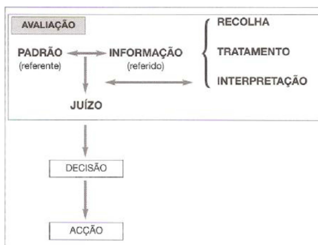
Figura n.º 1: Caracterização do “Conceito de Avaliação” (Alaiz et al., 2003: 10)

Segundo Alaiz, Góis e Gonçalves (2003: 10) avaliar “significa examinar o grau de adequação entre um conjunto de informações e um conjunto de critérios adequados ao objectivo fixado, com vista a tomar uma decisão”. Assim sendo, “a avaliação termina na formulação do juízo de valor ou mérito, antecedendo a tomada de decisão, mas não se confundindo com ela” (ibidem) como nos mostra a Figura n.º 1.